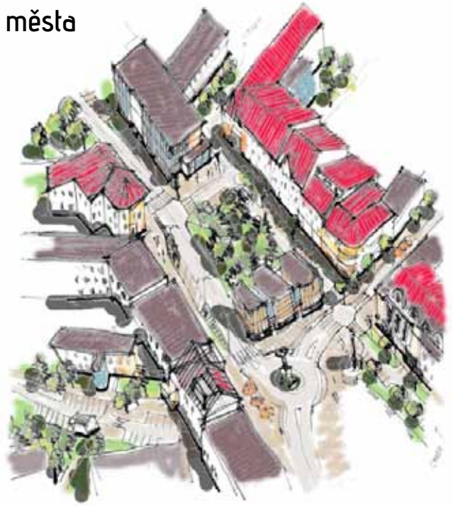
Koncepční skica náměstí ve Žďáře nad Sázavou -> taky nevěříte vlastním očím? :-)

Ale proč smutnit. Vždycky jde takový stav změnit. Postupně, ale jde to. Pořád máme dominantu kostela a budovu staré radnice, pořád tu jsou některé staré domy a pořád tu je morový sloup, ale také je tu pořád příležitost vše změnit, otočit, pochopit, souznít, harmonizovat, vrátit sem život a probudit to srdce, vytvořit nového ducha a přijmout jej do celého města, rozzářit jej v krajině a citlivě s ní propojit. To všechno je možné a jde to. Stačí na to jediné - chtít.