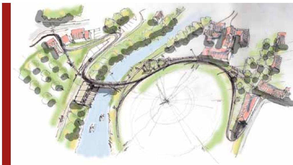
Výsledný návrh: Park Farská humna