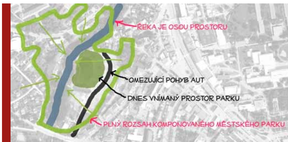
Park Farská humna má úplně jiný rozměr - pohledově i funkčně zahrnuje mnohem více prostorů